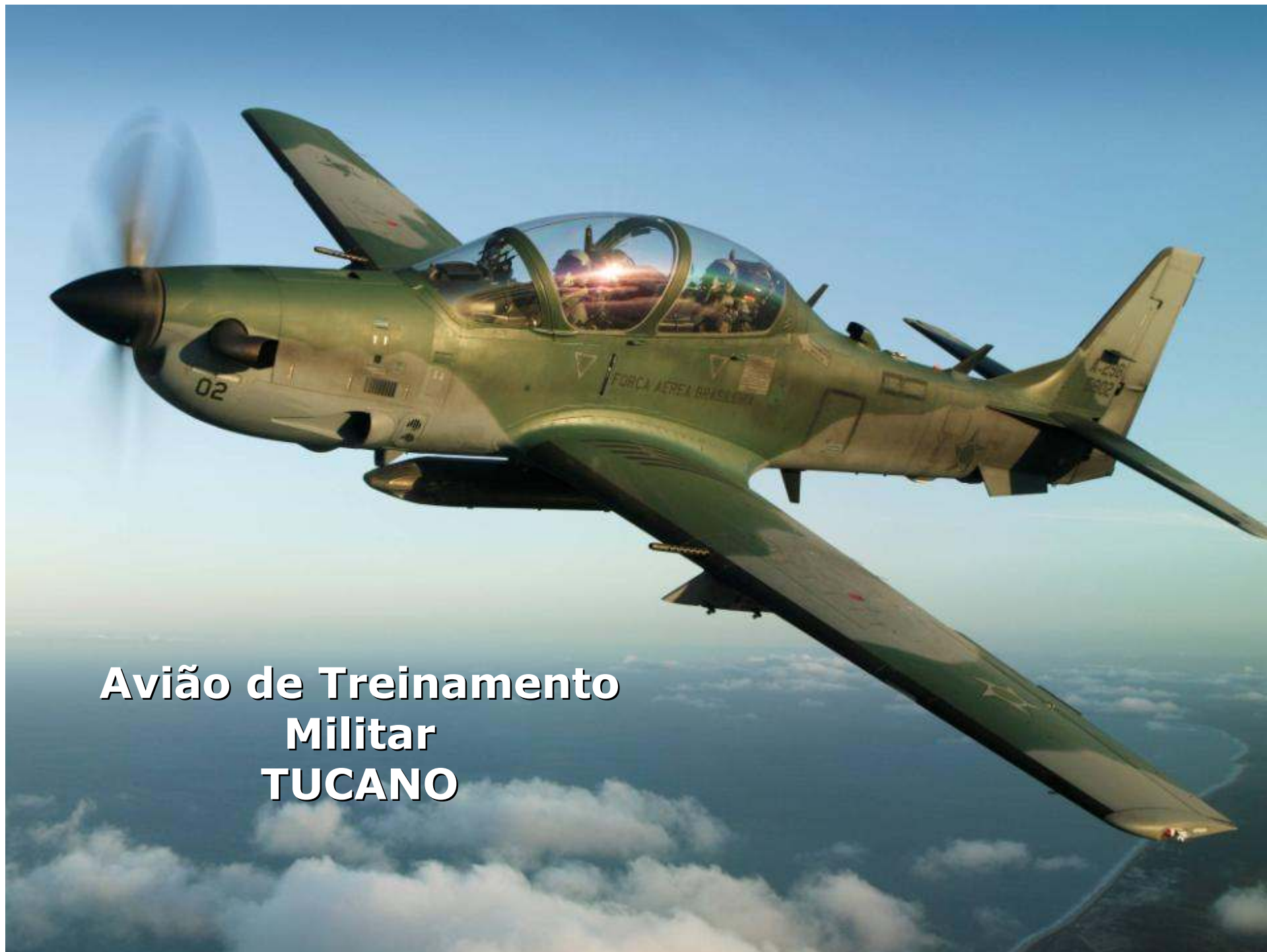
Avião de Treinamento Militar TUCANO