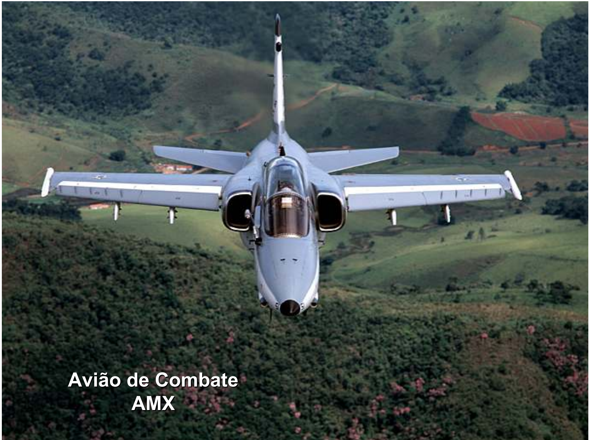
Avião de Combate AMX