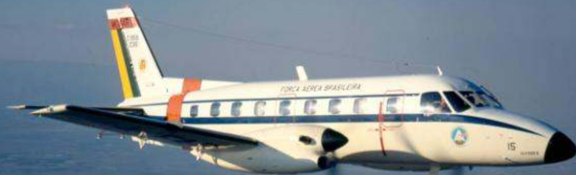
Avião de Transporte Aéreo Regional EMB 110 - Bandeirante