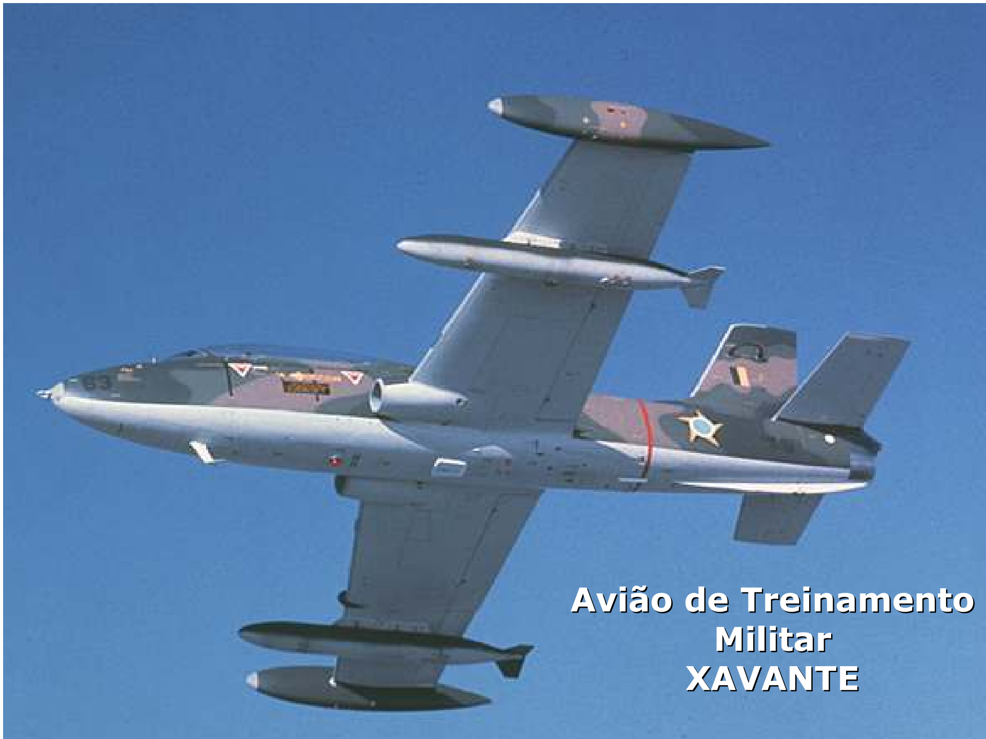
Avião de Treinamento Militar XAVANTE